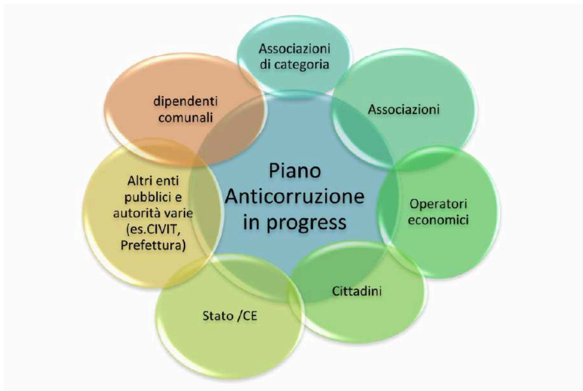
Figura 1 - Piano Anticorruzione Comunale e portatori di interessi